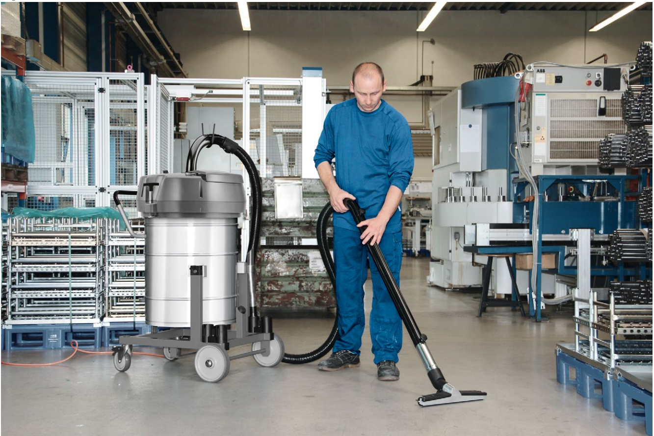
IVR-L 100/24-2 Tc Me