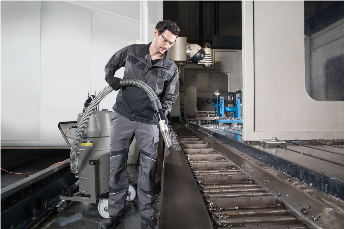
IVR-L 65/12-1 Tc