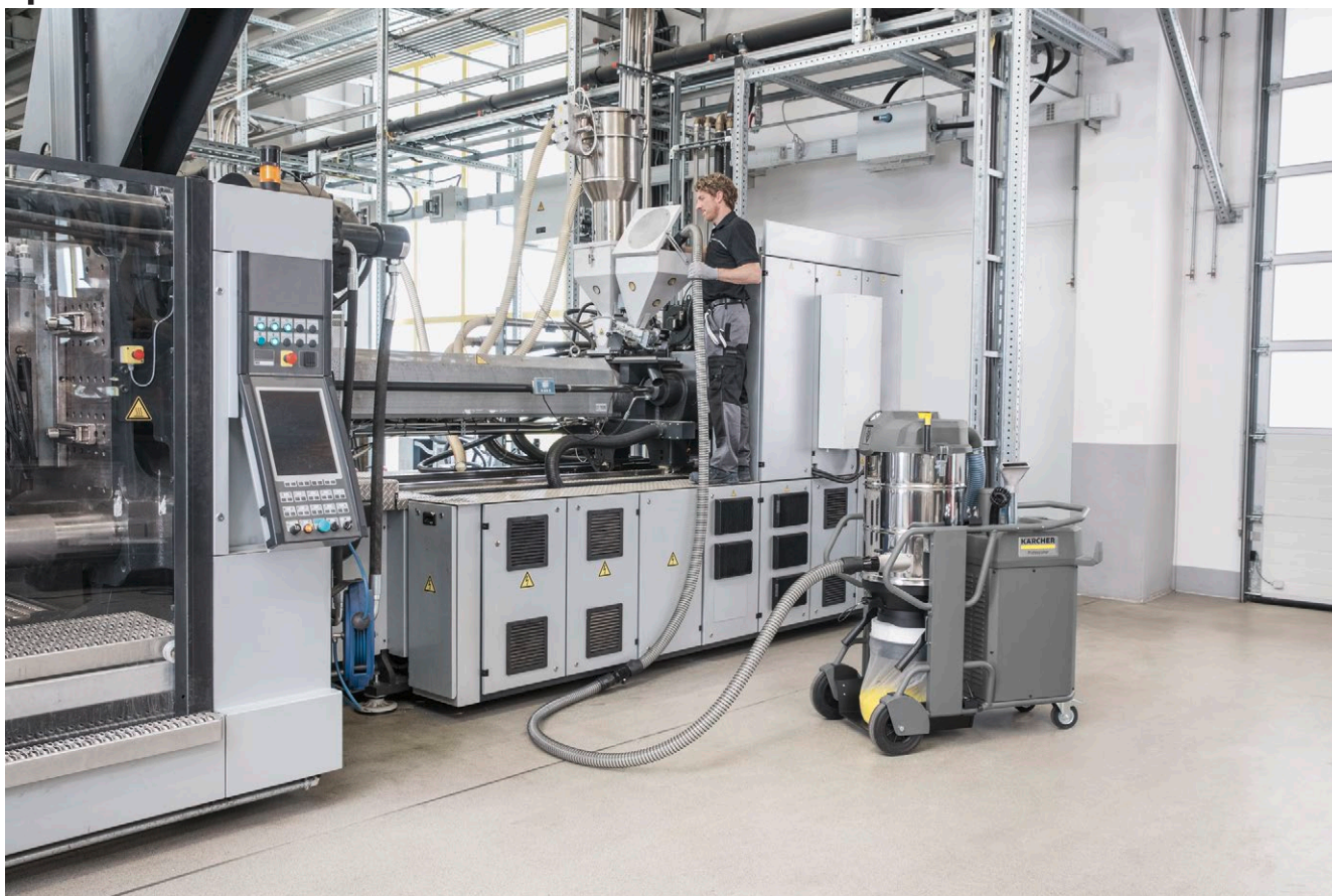
IVS 100/75 Lp