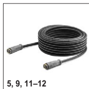
5, 9, 11-12