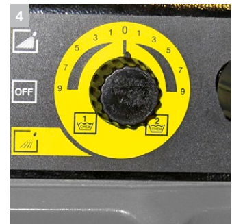
4 Точное дозирование чистящего средства