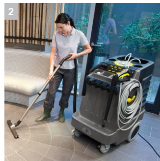
2 Включая функцию всасывания